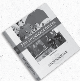
Het Sovjetexperiment Hoorcollege over de moderne geschiedenis van Rusland Auteur: Henk Kern