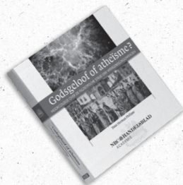
Godsgeloof of atheïsme? Hoorcollege over de filosofische strijd der wereldbeschouwingen Auteur: Herman Philipse