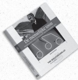
De menselijke toon Hoorcollege over de filosofie van de moderne mens Auteur: Ger Groot