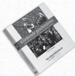
Klinkende geschiedenis Hoorcollege over de westerse muziekgeschiedenis Auteur: Leo Samama