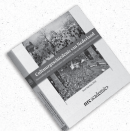
Cultuurgeschiedenis van Nederland Hoorcollege over de historische ontwikkeling van de Nederlandse identiteiten Auteur: Herman Pleij