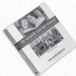
De waarde van het woord Hoorcollege over de Nederlandse literatuur en cultuur in de 19e eeuw Auteur: Marita Mathijssen