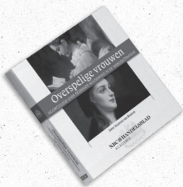
Overspelige vrouwen Hoorcollege over desperate housewives in de wereldliteratuur Auteur: Maarten van Buuren