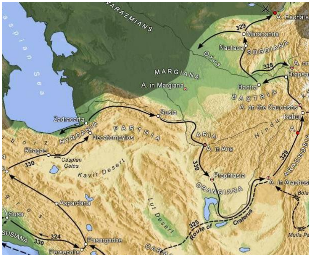
Alexanders opmars door Iran en campagnes in Centraal-Azië (3310-327 v.Chr.)