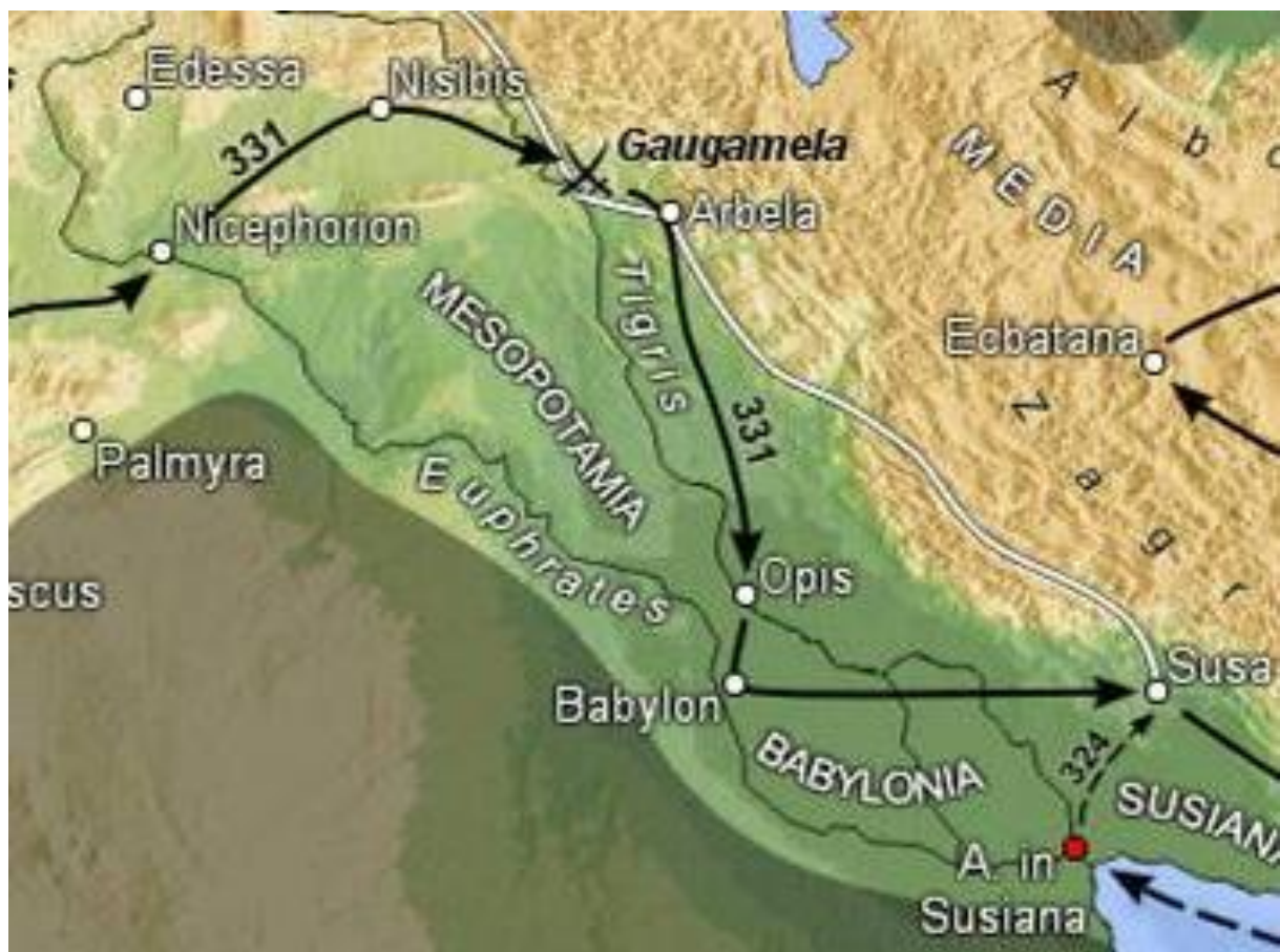
Alexanders opmars door Mesopotamië en Elam (najaar 331 v.Chr.)