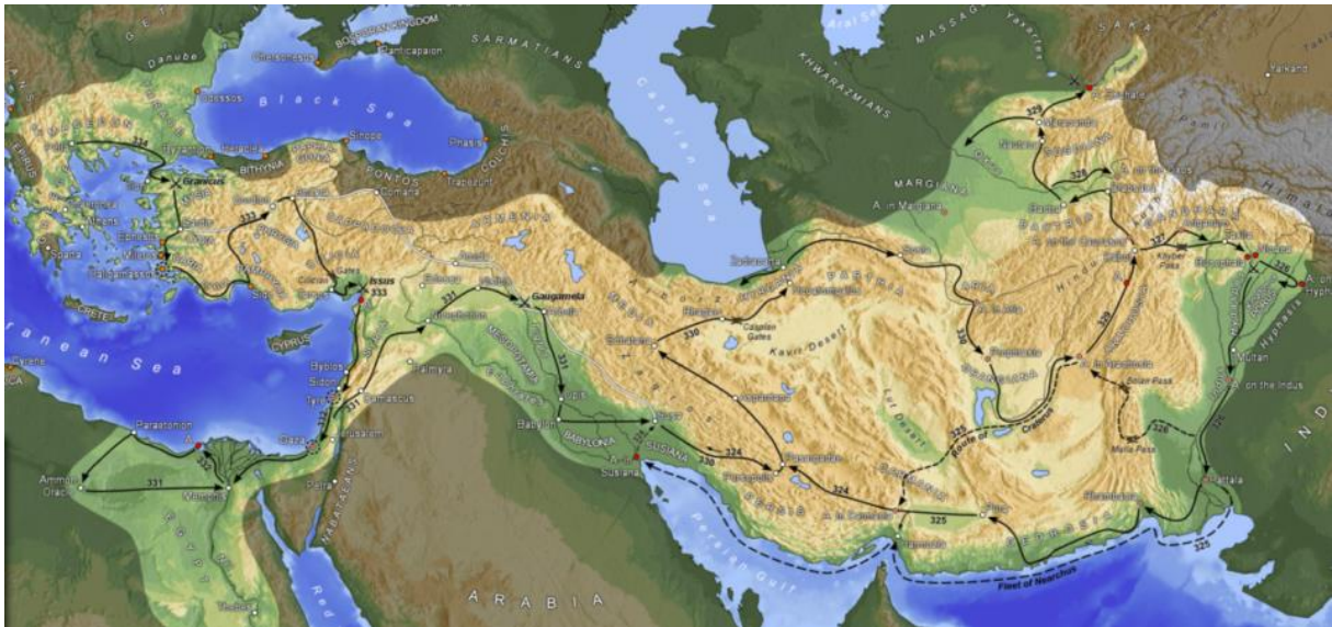
Het Perzische Rijk