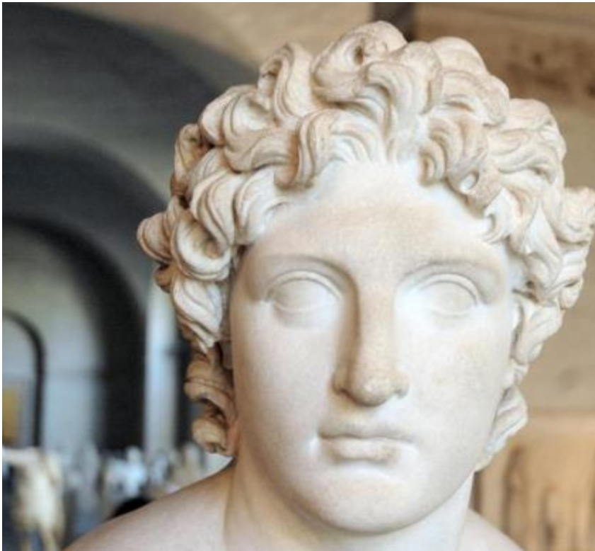
Jeugdportret van Alexander (“Rondanini-Alexander”, Glyptothek München)