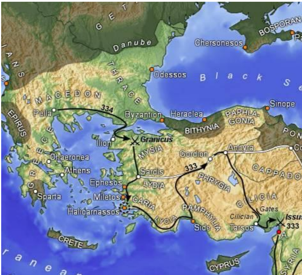
Het Assyrische Rijk rond 670 v.Chr.