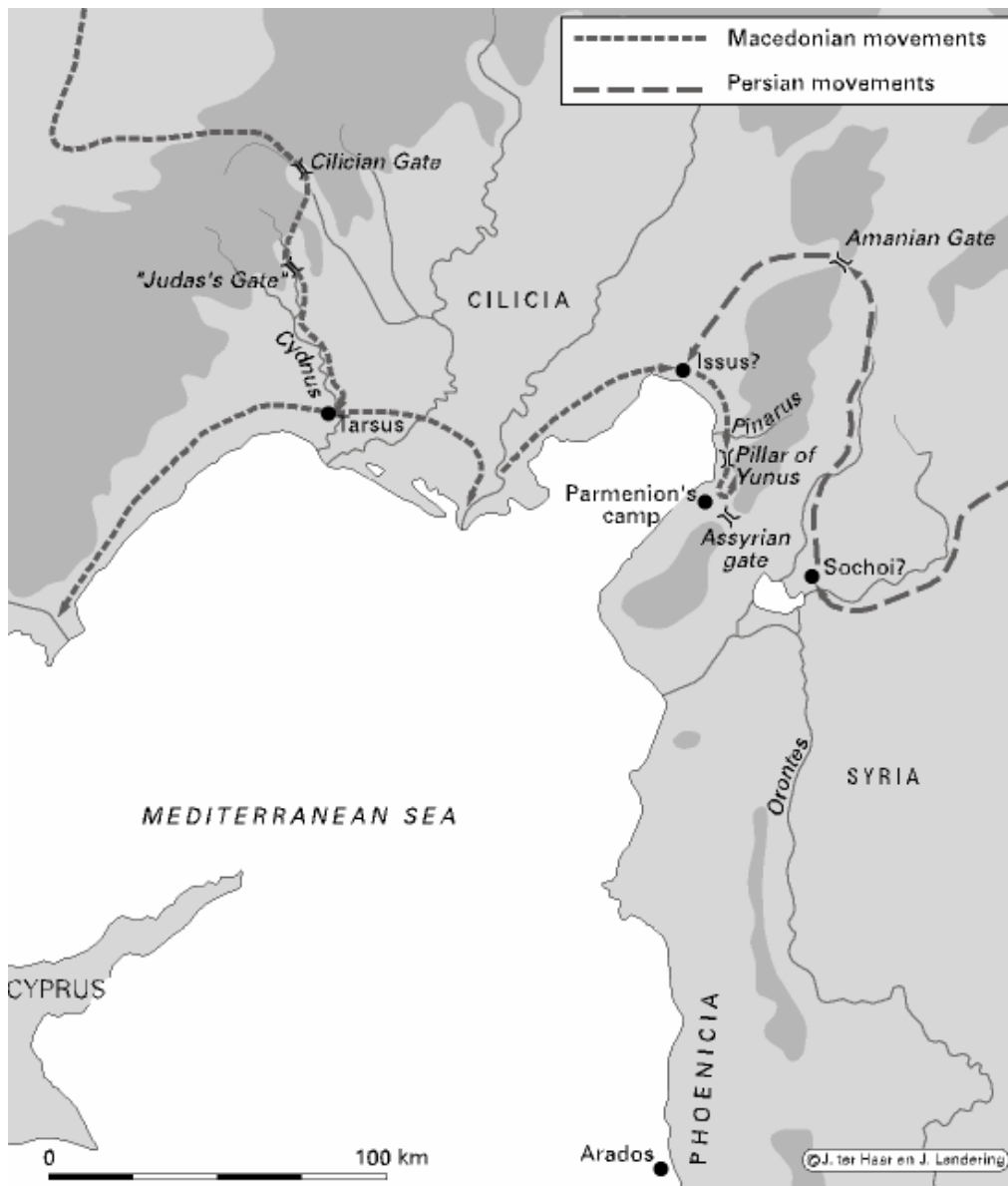
De manoeuvres vlak voor de veldslag bij Issos (oktober/november 333 v.Chr.)