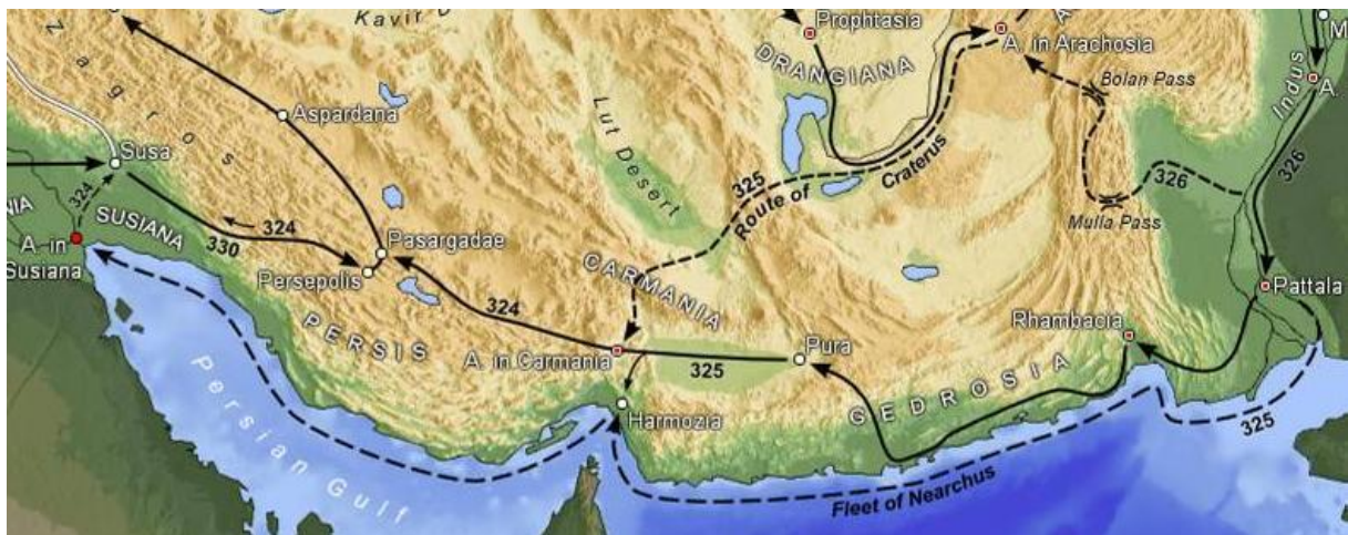
De terugkeer uit het verre oosten: Alexanders route (parallel aan de kust), de route van Alexanders admiraal Nearchos (over zee) en de route van Alexanders generaal Krateros (noordelijk).