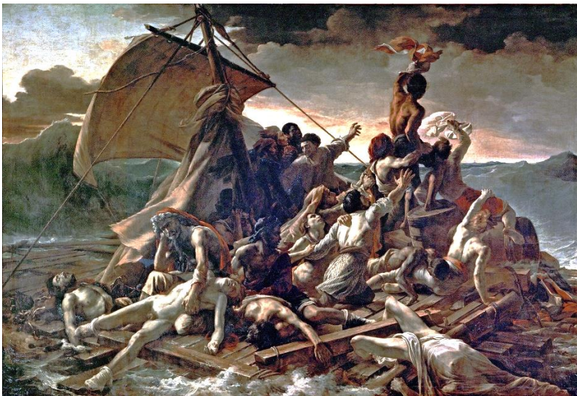
Théodore Gericault – Le radeau de la Méduse (1819)

Berlioz werd overwegend privé opgeleid. Daardoor ontwikkelde hij een grote antipathie voor academisme. Op elk terrein van het muziek maken, ten aanzien van de vormenleer, de harmonieleer, de orkestratie, heeft Berlioz alle regels aan zijn laars gelapt. Met als gevolg menig botsing met de muzikale autoriteiten. Tegelijkertijd was hij een scherpzinnig luisteraar, had een geweldige partituurkennis en koos zo zijn eigen voorbeelden met zorg uit. Met name Gluck en Beethoven. Na verschillende pogingen kreeg hij in 1830 de Prix de Rome voor Sardanapale . Intussen las hij alles wat los en vast te vinden was, met grote voorliefde voor Byron, Shakespeare en Goethe.