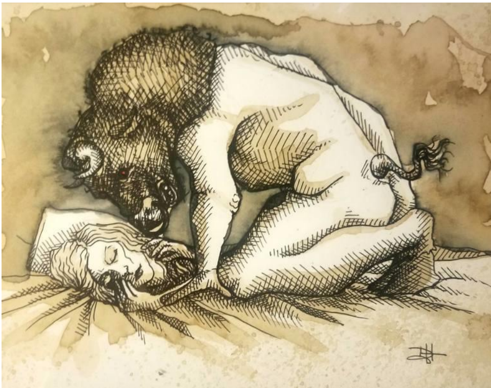
Minotauris en slapende vrouw door Pablo Picasso (geschilderd in 1933)