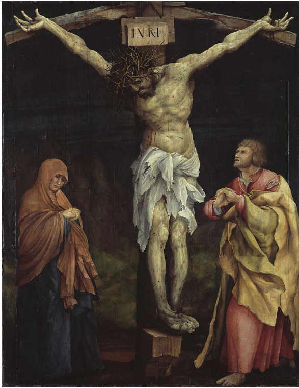
Het Isenheimer altaar van Matthias Grünewald (geschilderd in de periode 1512 – 1515)